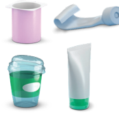
Botes y tubos