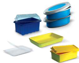
Bandejas y terrina