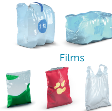
Bolsas y paquetes